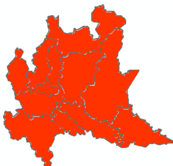
DOMANI SABATO 27/06